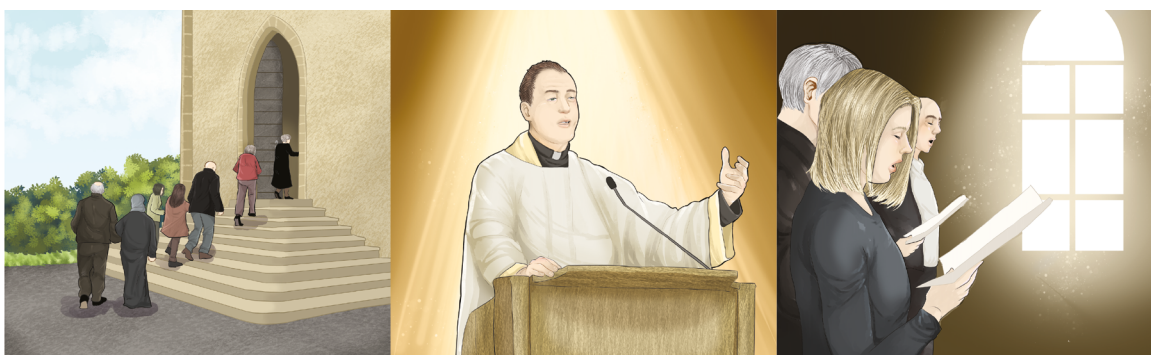
Jag går in i kyrkan.

Dragspelsböcker, bilder på rad med kort text under.